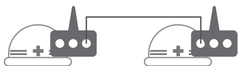
最大通話距離 1,600m(2 台でのご利用時)